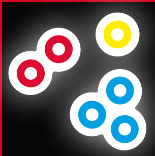
CLOUD 20 CLOUD COLOR 23

MEHR DETAILS KATALOGSEITE | FURTHER INFORMATION CATALOGUE PAGE